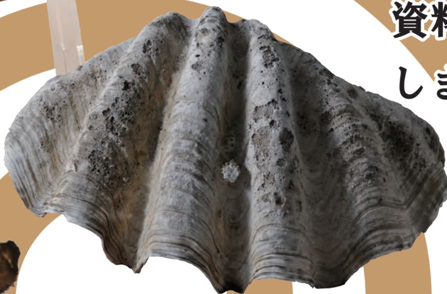
オオシャコガイ（地学・新収蔵）