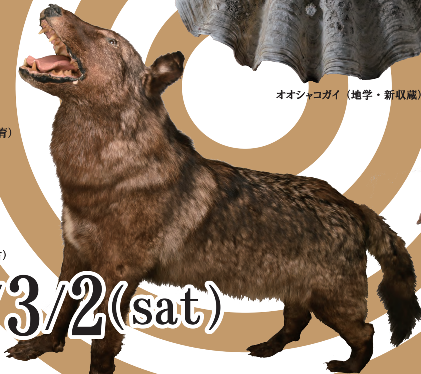
ハイロオオカミ（動物・新収蔵）