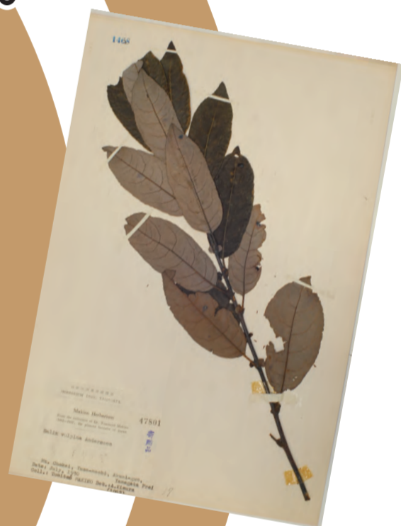
キツネヤナギ（植物・新収蔵・展示予定）