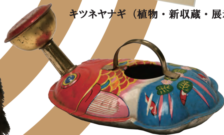
ブリキのじょうろ（民俗）