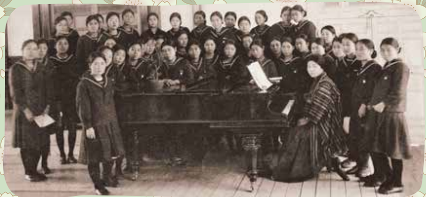
鶴岡北高等学校（鶴岡高等女学校）