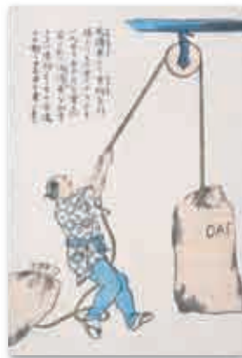
幼童家庭教育用絵画