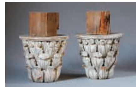
師範学校の柱頭飾り