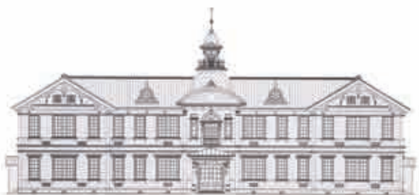
「重要文化財旧山形師範学校本館正門修理工事報告書」より

山形県立博物館教育資料館は、山形県立博物館の分館として昭和55年に開館しました。展示室は、明治の面影をそのまま残す「旧山形師範学校」の教室を活用しています。江戸時代から現代に至るまで、山形県の教育に関するあゆみを知ることができる展示となっています。