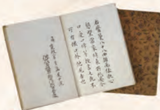
3 尾花沢市指定文化財「霧築伝授書(八十八曲譜面)」(個人蔵)