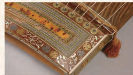
7 筑紫琴(荘内神社蔵)