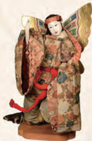
1 加藤家の古今雜より「胡蝶の舞」(個人蔵)

山形県内では、江戸時代後期に最上川舟運でもたらされた尾花沢雅楽が宮廷音楽の流れを汲んでおり、また、古くは平安時代に林家舞楽が伝わり独自の発展をとげました。本展示では「やまがたに息づく意外な雅楽の歴史と現在」を紐解いていきます。