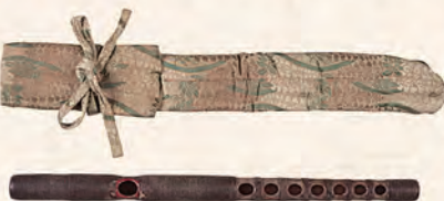
5 龍笛 銘戸奈瀬 (彦根城博物館蔵)