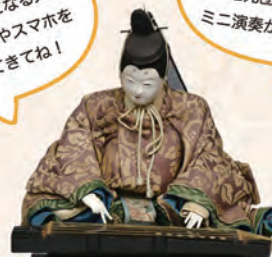
8 酒田の旧家に伝わる「舞人と七人の楽人」(個人蔵)