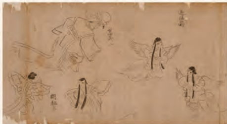
2 山形県指定文化財「舞楽図譜」(個人蔵)