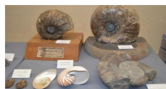
アンモナイトとオウムガイ

また、この会期中に5年目を迎える東日本大震災の被災資料も、文化財レスキューに取り組んだ東北大学総合学術博物館から借用しました。がれきの中から綺麗によみがえった化石もご覧ください。