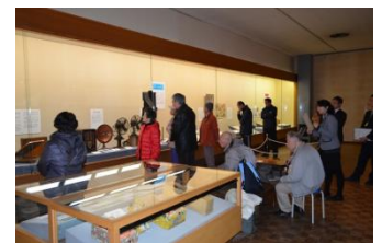
展示解説会の様子