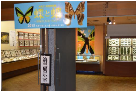
特別展「蝶と蛾 -妖精たちのつどい-」