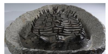
三葉虫ブルメイステラ