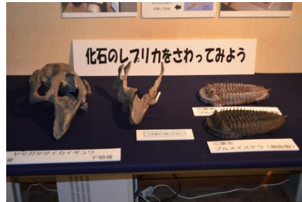
化石のレプリカをさわってみよう