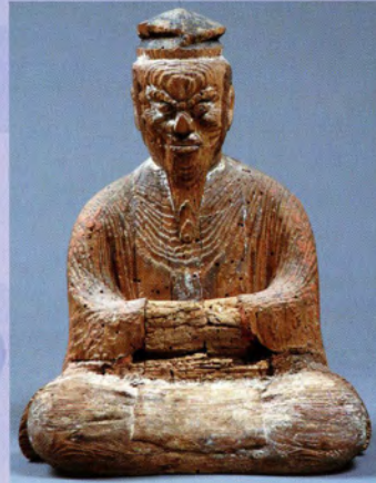
磐司盤三郎木像（立石寺所蔵）

本展は、今まで取り上げられることの少なかった山寺の歴史や習俗を、山内に残る古文書や仏像、工芸品などとともに多角的に明らかにしようとするものです。