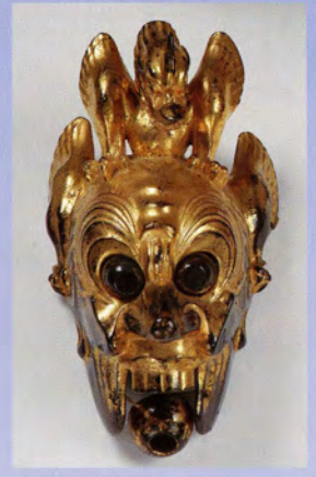
舞楽面（陵王）（立石寺所蔵）