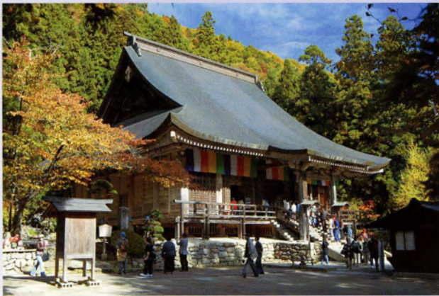
国指定重要文化財 立石寺根本中堂