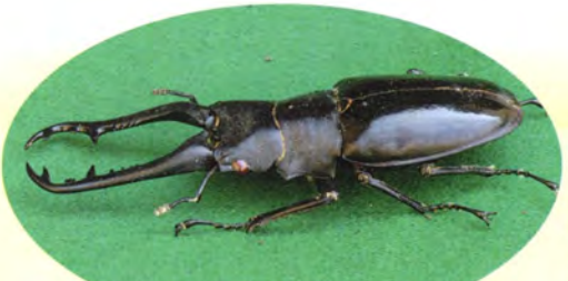
ギラファノコギリクワガタ