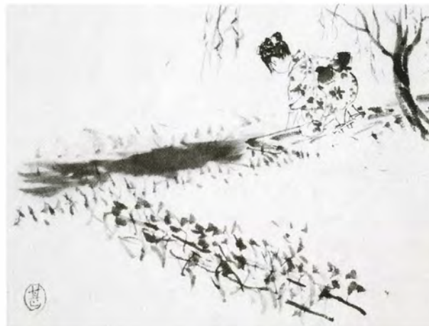
「蟬しぐれ」挿絵原画（財団法人致道博物館蔵）

時代小説の舞台としてたびたび登場するのが海坂藩です。北国の小藩とされるこの架空の藩は、荘内藩をモデルにしていると考えられています。海坂藩には、作者のふるさと、鶴岡の面影が色濃く映し出されています。