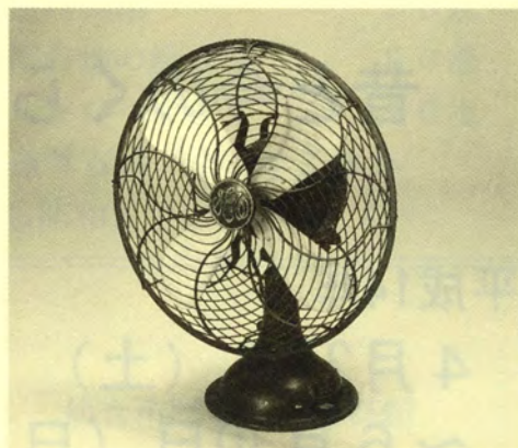
扇風機(せんぷうき)

ここでは、現在の電化製品やプラスチック製品などがあらわれる前の、明かりの道具、暖まる道具、洗濯や裁縫の道具、その他さまざまな住まいの家具や道具をみていきましょう。今のような道具にあたるのか、また、どのように使用したのかを考えてみましょう。