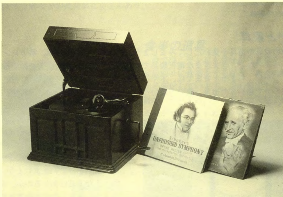
蓄音機(ちくおんき)とレコード