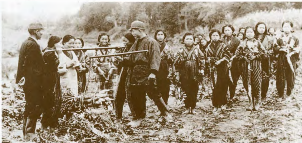
写真上:昭和18年中野目須川杉林跡開墾の畑から