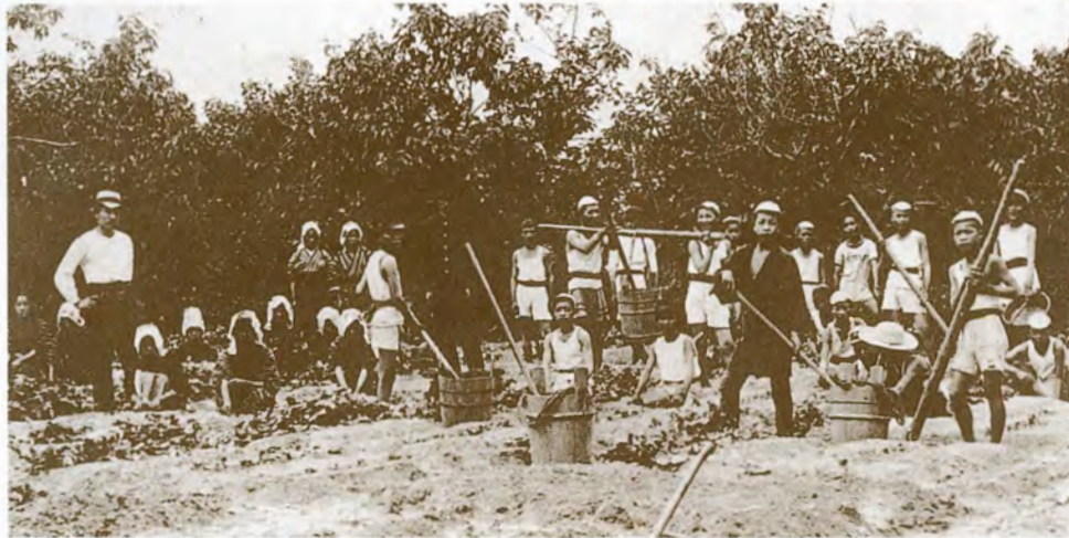
下:昭和16年立谷川の開墾