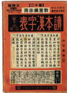
「教室掲示用 読本漢字表」尋常6年