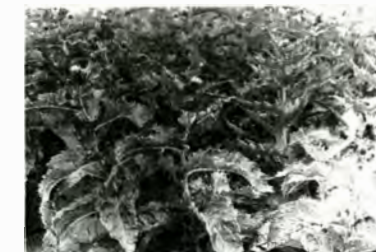
◀ウゴアザミ(山頂部)

岩れきからなる風衝地や山頂部はさらに環境が厳しくなり、高山性低木群落が発達できなくなります。ここでは、イワウメ・ミヤマクロスゲ・コメバツガザクラ・ミヤマウスユキソウ・ヒナコゴメグサ・チシマギキョウ・コタヌキラン・ウラシマツツジ・ミネズオウ・キバナノコマノツメ・コメススキ・ハクサンフクロ・トウゲブキ・ヨツバシオガマ・ウサギギクなどの高山植物がお花畑となっています。中でも、クロユリ・ミヤマシオガマ・トウヤ