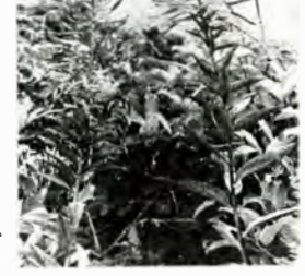
▲ハクセンナズナ(山頂付近)

クリンドウ・ジムカデ・ウゴアザミ・リシリシノブ・エゾノツガザクラ・ハクセンナズナなどは特に珍重される植物です。