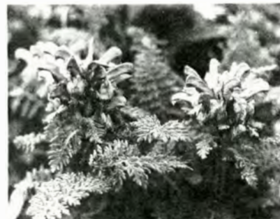
▲ミヤマシオガマ(山頂付近)