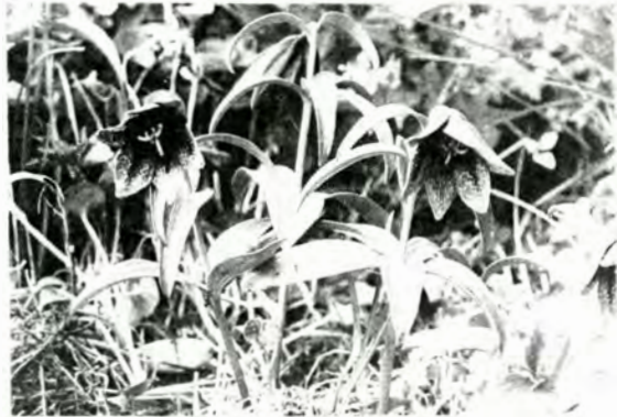
▲月山々頂のクロユリ