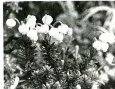
▲エゾノツツガザクラ(牛首付近)

ものといわれており、特に山頂東斜面の大雪城等は一般に万年雪として知られています。これらの広大な雪田は雪が消えるにしたがって、小さくなり、雪田植生は周辺部から中心部に向かって次第に展開し、