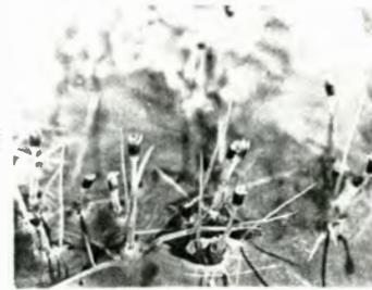
▲ミヤマヒナホシクサ(弥陀ヶ原)