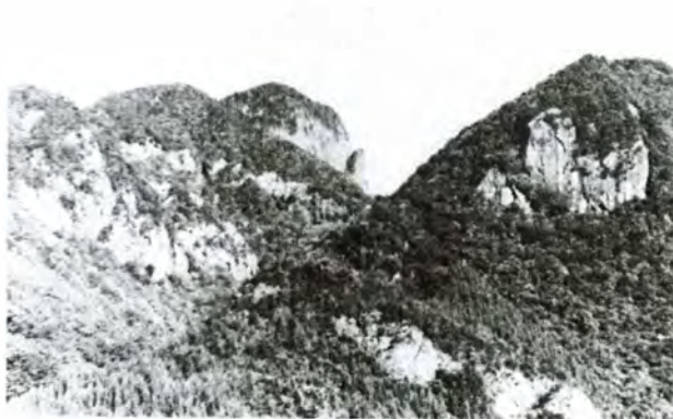
岩峰の発達する奥山寺