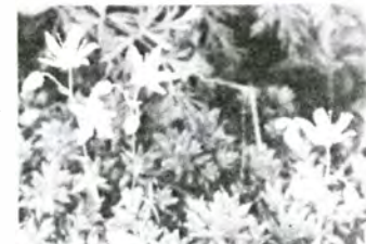
寒地系遺存植物シコタンソウ

シコタンソウ・アサギリソウ・ミヤマラッキョウ・ミヤマハタザオ・バンダイクワガタ・ハクサンサイコ・イワインチン・カモメラン・ウチョウラン