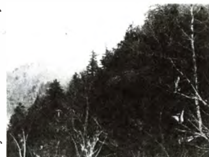
急斜面に見られるキタゴヨウ・クロベ林分

ブナ帯にあって、狭い尾根すじや西と南に面した急斜面では土壌が乾いて貧栄養性となるため、キタゴヨウやクロベ群落帯に生育します。林床は、強酸性、貧栄養のためにウスノキ・オオバスノキ・アクシバなどのツツジ科の低木が目立ちます。