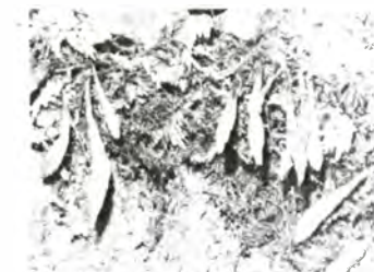
岩壁に着生する暖地系のヒメサザラン

コアカソ・ヤマミズ・キバナウツギ・スズタケ・ヒナスミレ・トウゴクミツバツツジ・センダイトウヒレン・ゴヨウツツジ・アブラツツジ・フジウツギ・ホソバツルリンドウ・クロカンバ・ハナマキアザミ・バイカツツジ